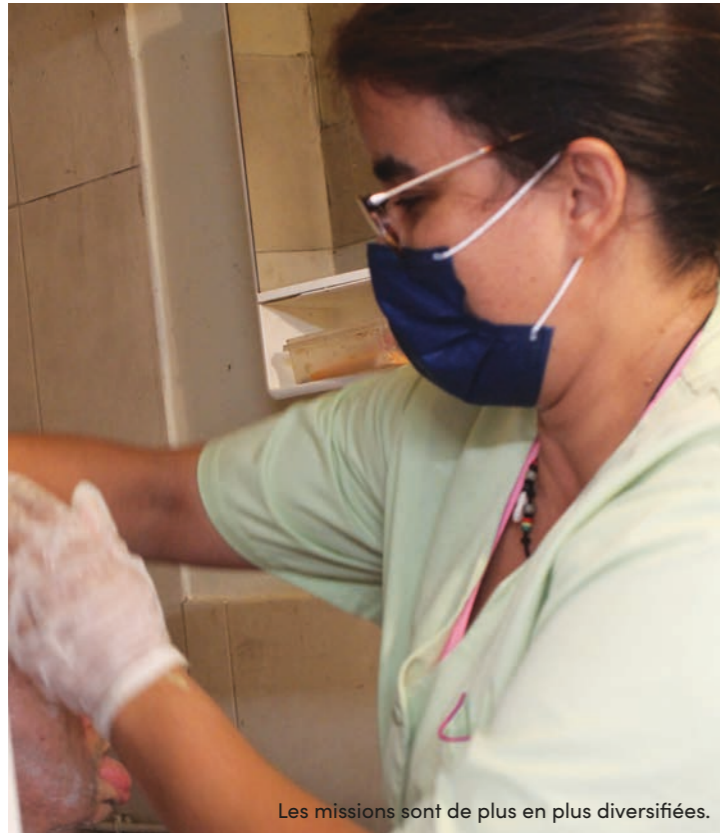
Les missions sont de plus en plus diversifiées.