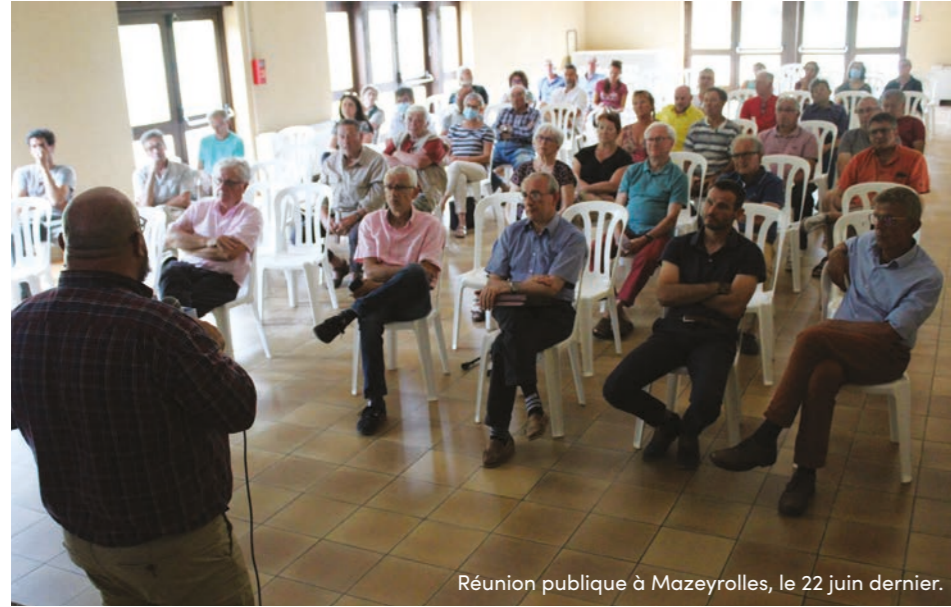
Réunion publique à Mazeyrolles, le 22 juin dernier.

La communauté de communes est allée à la rencontre des habitants et des élus pour expliquer la démarche du Plan local d'urbanisme intercommunal (PLUi). Cette première phase marque le début de la concertation.