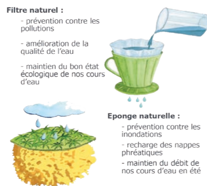
Illustration : Syndicat du bassin de la Sélune

Les zones humides sont une des solutions aux problèmes liés aux changements climatiques (réchauffement, inondations...). Souvent positionnées en bordure de ruisseaux, elles captent les eaux de ruissellement. Leur composition leur confère un rôle d'éponge et de filtre (schéma). Grâce à la multitude d'habitats qu'elles combinent, une riche biodiversité s'y épanouit.