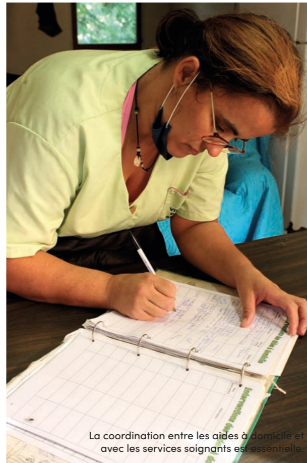
La coordination entre les aides à domicile et avec les services soignants est essentielle.