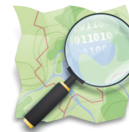
Carte réalisée avec Umapopenstreetmap