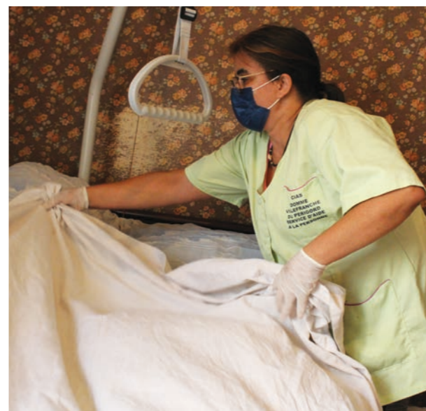
L’entretien du logement fait partie du quotidien d’une aide à domicile.

“Quand les personnes sont réticentes, il faut composer, accepter et être souple”