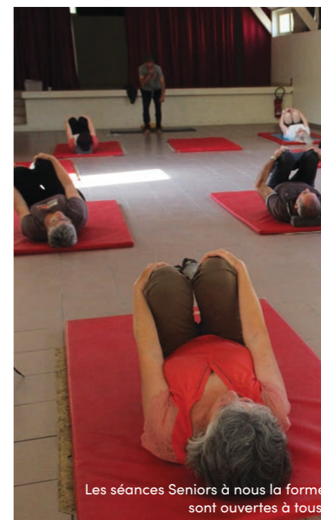
Les séances Seniors à nous la forme sont ouvertes à tous.

● Cours encadrés par un éducateur formé au sport adapté. Participation : 5 € par séance, le reste est pris en charge par la commune. À Mazeyrolles, le jeudi de 16h30 à 18h pour les retraités et de 19h à 20h30 pour les actifs.