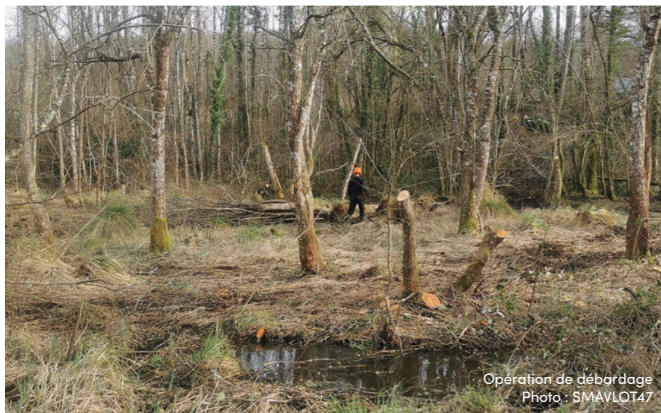
Opération de débardage

Le SMAVLOT 47 a procédé à des travaux de restauration d'une zone humide dans la vallée de la Lémance, sur le lit du cours d'eau La Bessoulière, à Besse.