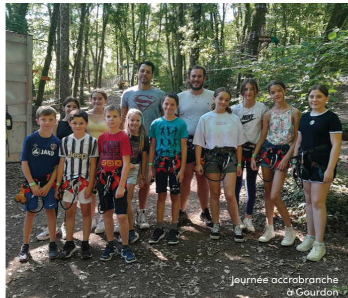
Journée accrobranche à Gourdon

Essai transformé pour l'Espace Jeunes, qui a fait le plein pendant ses trois semaines d'ouverture en juillet ! L'occasion, pour la dizaine d'ados inscrits venus des quatre coins du territoire, de profiter de sorties et d'activités ludiques sur place.